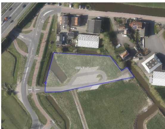
De Stompwijkseweg/Kostverlorenweg (opp. +- 4200m 2 )

De eerste stap van deze locatiestudie was een scan van een aantal alternatieve locaties in de rand van het buitengebied gevormd door de Kostverlorenweg, de Stompwijkseweg (tot aan de drie molens) en het Wilsveen (tot aan de drie molens). Uit de locatiescan bleek de recreatieve parkeerplaats naast de Begraafplaats (locatie Wilsveen) de moeite waard om verder te onderzoeken. Hieronder zijn per vakgebied de voor- en nadelen van de locatie Wilsveen in vergelijking met de bestaande locatie aan de Stompwijkseweg/Kostverlorenweg aangegeven. Ook wordt ingegaan op de te doorlopen processtappen.