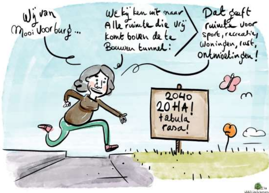
Afbeelding 14: Wens van Mooi Voorburg