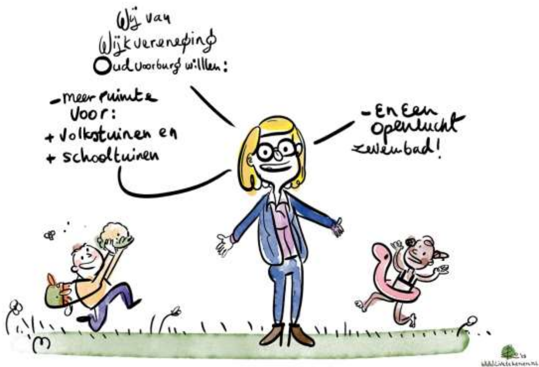
Afbeelding 17: Wens van wijkvereniging Oud Voorburg