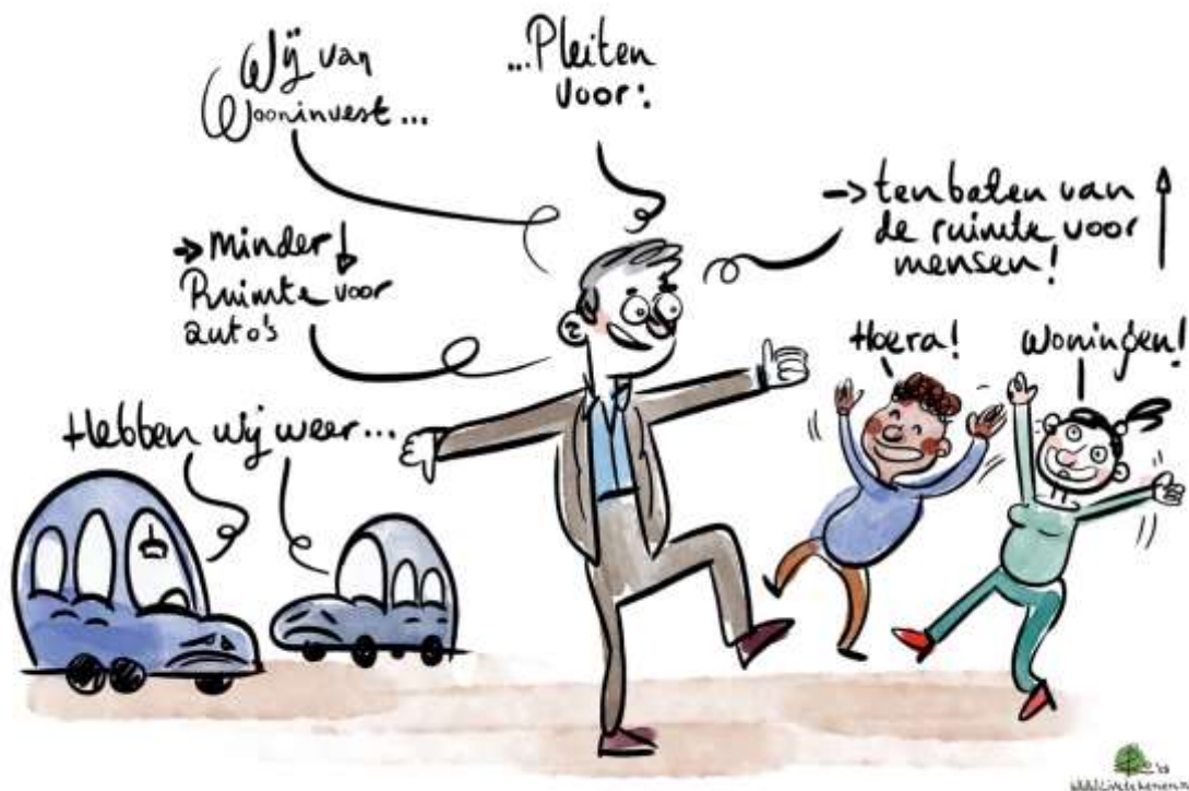
Afbeelding 15: Wens van WoonInvest