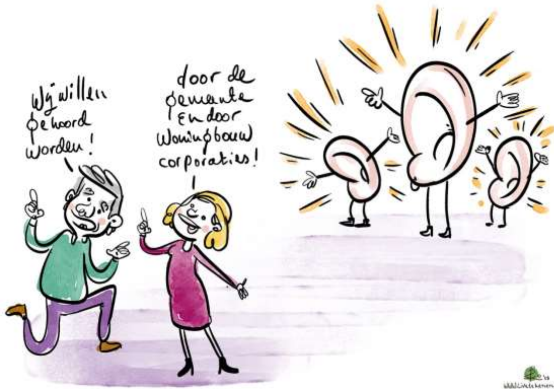
Afbeelding 12: Wens van huurdersverenigingen