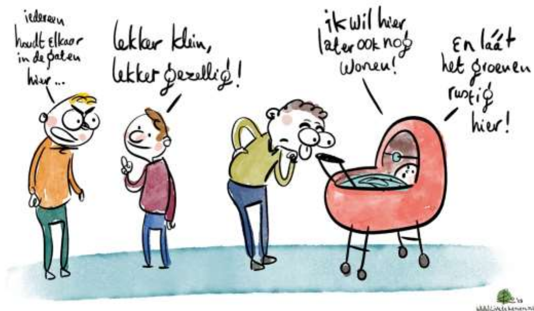
Afbeelding 13: Wens van Adviesraad Stompwijk