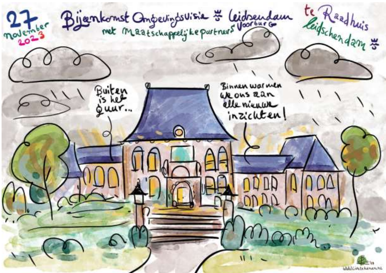
Afbeelding 1: introductie afbeelding van de bijeenkomst in het Raadhuis