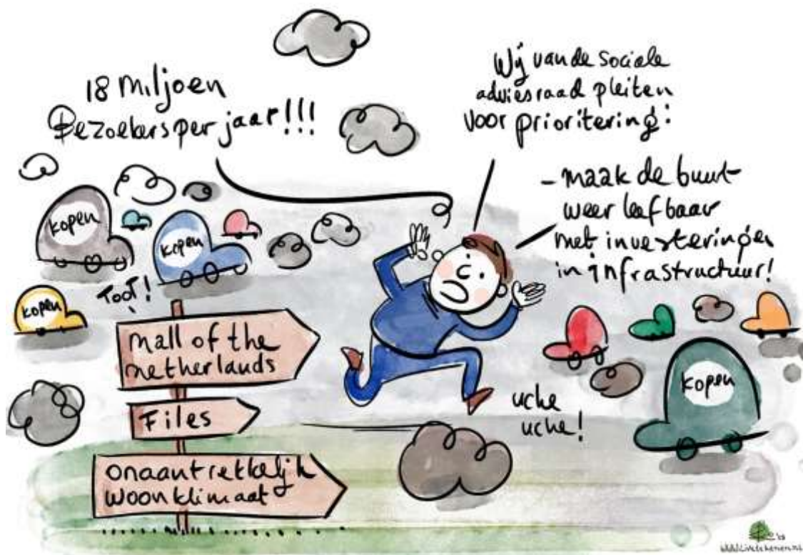
Afbeelding 8: Wens van Adviesraad Sociaal Domein