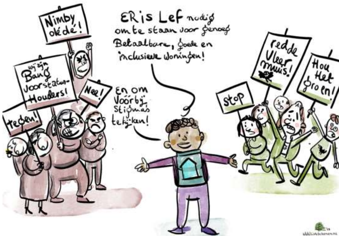
Afbeelding 9: Wens van woningcorporatie Vidomes