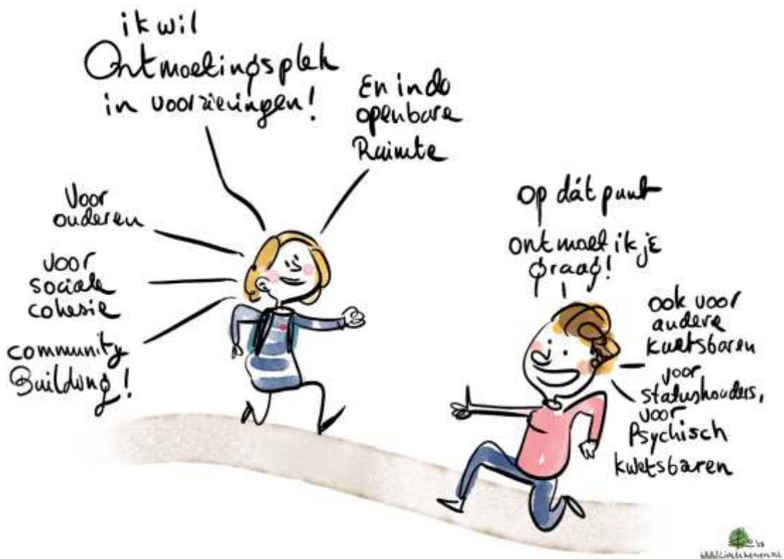
Afbeelding 10: Wens van Reakt, onderdeel Parnassia groep