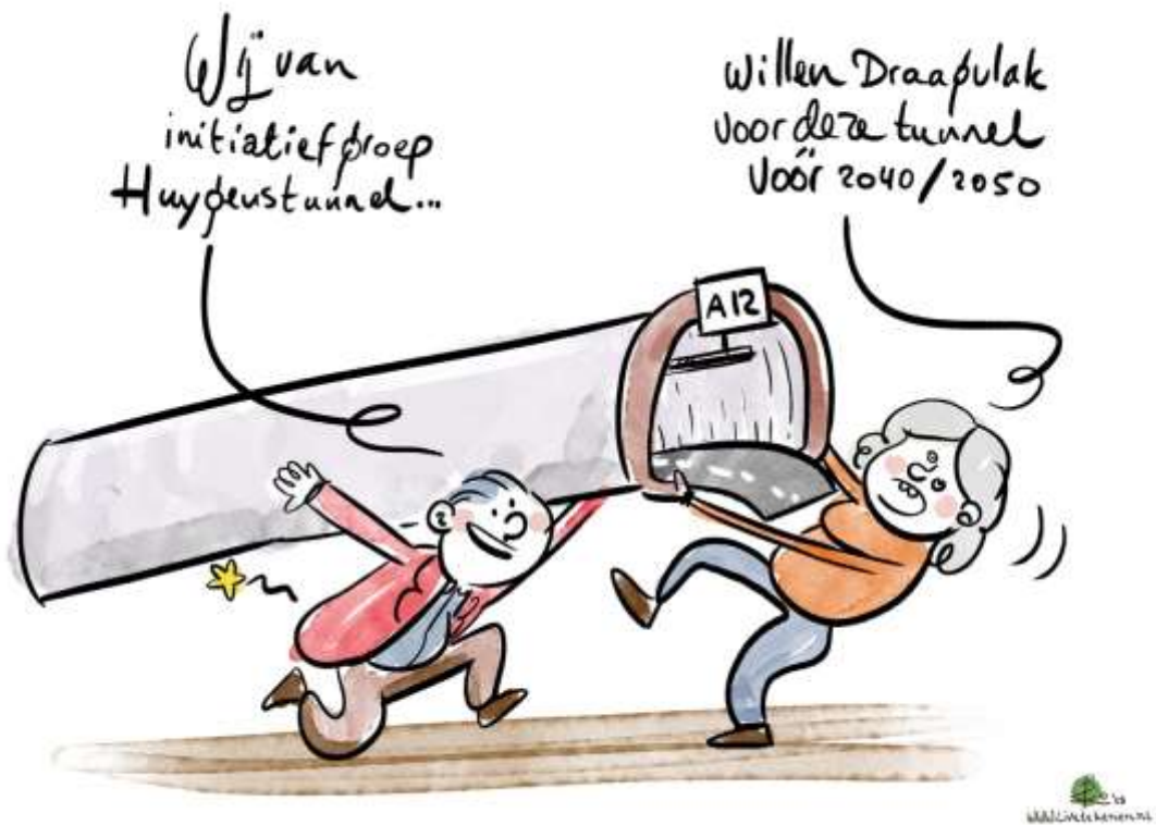
Afbeelding 11: Wens van InitiatiefGroep Huygenstunnel